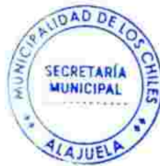
27 Axel Eduardo Solís Vásquez