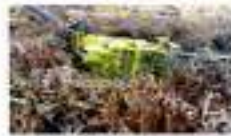
ESTRATEGIA DE MANEJO DEL FUEGO DEL REFUGIO DE VIDA SILVESTRE MIXTO CAÑO NEGRO